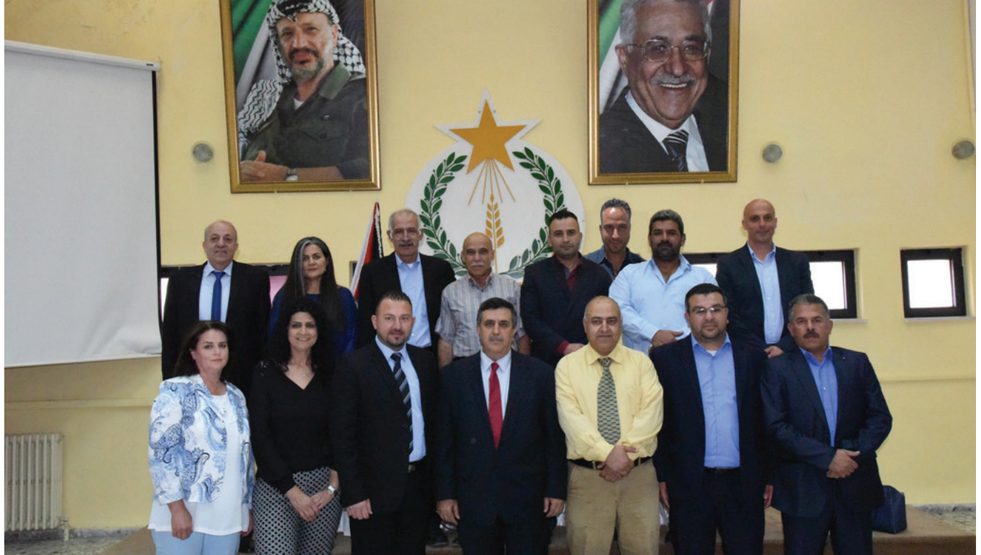
رئيس وأعضاء مجلس بلدية بيت لحم ٢٠١٧