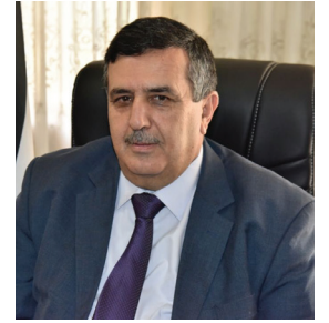
كلمة رئيس البلدية المحامي أنطون سلمان

نضع بين أيديكم خلاصة إنجازات البلدية التي تحققت في عام ٢٠١٨ في مختلف المجالات الخدمائية والتنموية، حيث أننا في بلدية بيت لحم بذلنا جهدنا منذ إستلامنا زمام العمل على إنجاز عدد من المشاريع تحاكي حاجة المدينة ونفذنا قسماً منها، كما أننا في بلدية بيت لحم نسعى دائماً إلى تقديم الخدمة المميزة لمدينتنا الحبيبة ولمواطنيها ونعدكم بمواصلة الجهود لتحقيق مزيد من العطاءات للوصول إلى مستويات أعلى في التنمية والخدمات، وللنهوض بعاصمة الميلاذ.